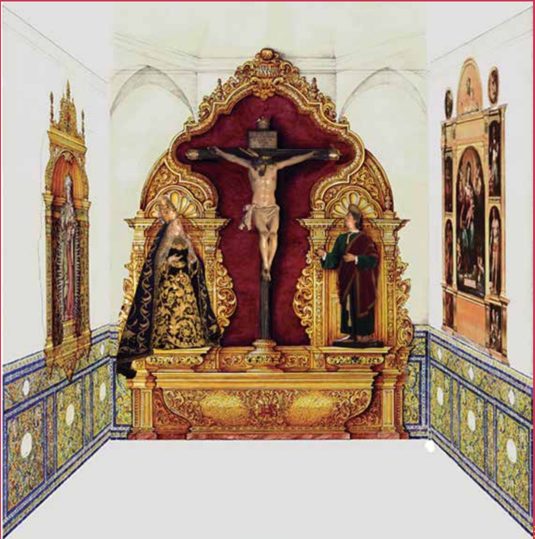
Proyecto de reforma y enriquecimiento de la capilla

Este fue llevado a cabildo general el 28 de octubre de 2016, como queda dicho, aprobándose por amplia mayoría, e iniciándose entonces los trabajos.