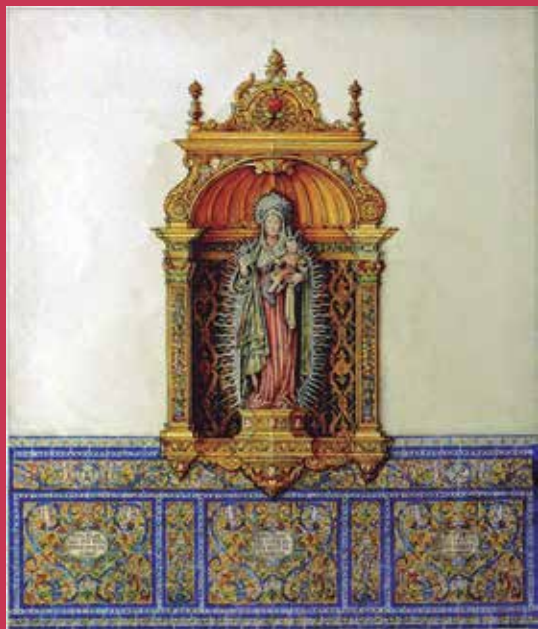
Proyecto de retablo-hornacina de la Virgen de la Cabeza gloriosa, del muro izquierdo de la capilla, con el zócalo cerámico que la decorará

El autor del proyecto señala que San Vicente es un templo con notables obras de arte de gran antigüedad, por lo tanto el primer condicionante del proyecto ha sido intentar fusionarlo con el recinto y lograr un cierto aire antiguo e histórico, acorde con el carácter de la hermandad. El segundo condicionante en orden de importancia, ha sido el empeño de realzar sobre todo la figura del crucificado en un retablo que no podía tener (por las medidas de la capilla) demasiada