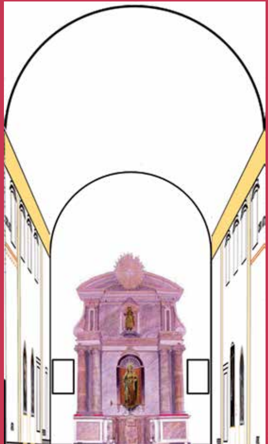
Reconstrucción idealizada de la capilla de la hermandad en el convento del Carmen según la descripción hecha por Bermejo

José Bermejo y Carballo, hermano mayor durante treinta años, la describe en su libro Glorias