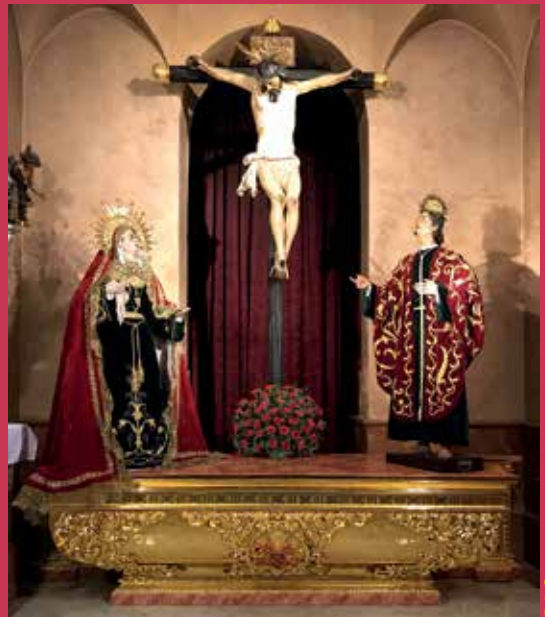
Primera fase del nuevo retablo, el banco, de octubre de 2018

Es la parte del proyecto que aún queda por concretar, pero se parte de una idea ya reali-