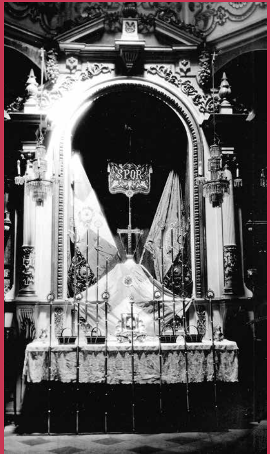
Altar de insignias colocado en 1933, foto más antigua existente de la capilla, en la que se aprecia el estado primitivo de la cúpula, con decoración, que se perdería al reconstruirse tras su hundimiento en 1936

Obligada a trasladarse a San Vicente, colocó sus imágenes en dos capillas, la de la Virgen